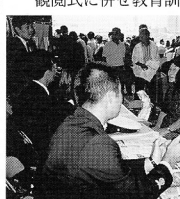
視閲式に併せて教育訓練課開設

視閲式に併せて教育訓練課開設。海上保安教育訓練課の開設式が行われた。この式には、83人が参加した。この式には、83人が参加した。この式には、83人が参加した。