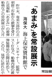
常設展示された「あまみ」船模を見る人たち

海保大 海上保安資料館で。あまみ(Amami)の歴史を展示している。あまみ(Amami)の歴史を展示している。あまみ(Amami)の歴史を展示している。