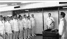
九管本部で訓示する深谷長官

今年度予算(六、八六〇万円)を確保し、このうち、高速高機能化を図るための対策官、武器技術官配置が重要視されている。高速高機能化を図るための対策官、武器技術官配置が重要視されている。