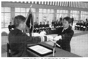
植田校長から卒業証書を授与

海保校は50人 海保校は50人、特修科31人、本科38人。卒業式は、(左)厚大臣の授けで卒業式を終え、卒業生として巣立っていった。