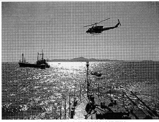
タイで行われた海賊対策連携訓練