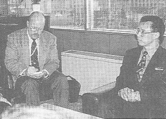
米軍施設を視察訪問したチャプリン司令官